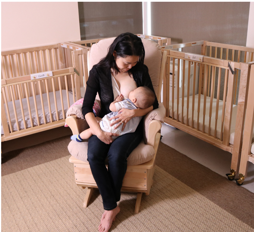
Ilustración 2: Espacio para Amamantar en una Guardería

La Ilustración 1 muestra un lugar para amamantar establecido en la sala de un hogar familiar que provee cuidado para niños. Este espacio incluye un asiento cómodo y luz tenue. Si las familias prefieren más privacidad, hay un biombo plegable, el cual aparece a la derecha, que puede ser instalado y recogido fácilmente. Como se muestra, cuando no está en uso, el biombo puede estar doblado a un lado de la silla. La pequeña mesa lateral ofrece un espacio para poner un vaso con agua o para mostrar recursos de lactancia.