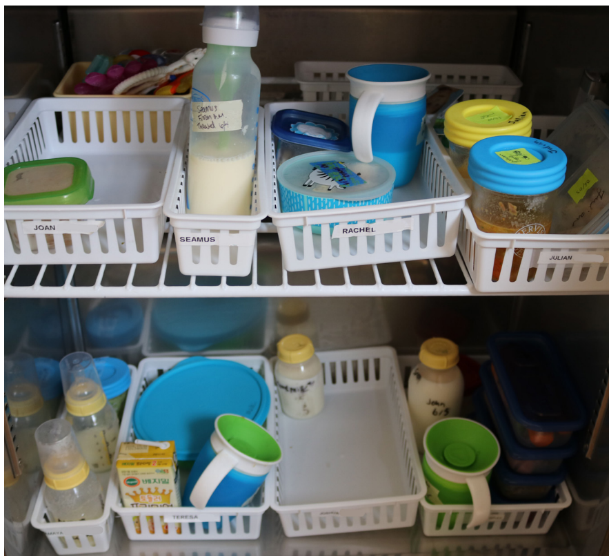
Ilustración 4: Almacenamiento de la Leche Materna en una Guardería

La Ilustración 3 muestra el almacenamiento de la leche materna en un hogar que provee cuidado para niños. Una sección del refrigerador es designada para almacenar la leche materna. Es permitido almacenar leche materna en un refrigerador domestico junto con otra comida y bebidas. La leche materna está siendo almacenada en botellas y bolsas y organizada en contenedores claramente etiquetados con el nombre de cada bebé. Las botellas y bolsas También son etiquetadas con el nombre cada bebé y con la fecha en la cual la leche fue extraída. El contenedor de la orilla izquierda tiene varias bolsas de leche en la parte trasera, enfatizando que la leche de la botella se debe usar primero.