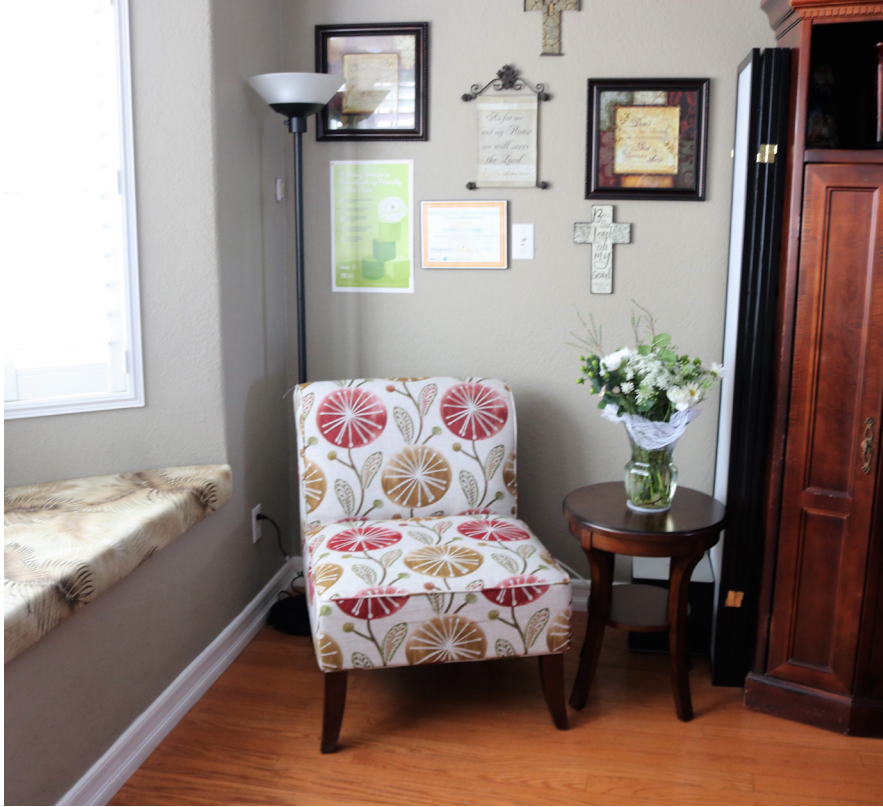
Ilustración 1: Espacio para Amamantar en un Hogar que Provee Cuidado de Niños

La Ilustración 1 muestra un lugar para amamantar establecido en la sala de un hogar familiar que provee cuidado para niños. Este espacio incluye un asiento cómodo y luz tenue. Si las familias prefieren más privacidad, hay un biombo plegable, el cual aparece a la derecha, que puede ser instalado y recogido fácilmente. Como se muestra, cuando no está en uso, el biombo puede estar doblado a un lado de la silla. La pequeña mesa lateral ofrece un espacio para poner un vaso con agua o para mostrar recursos de lactancia.