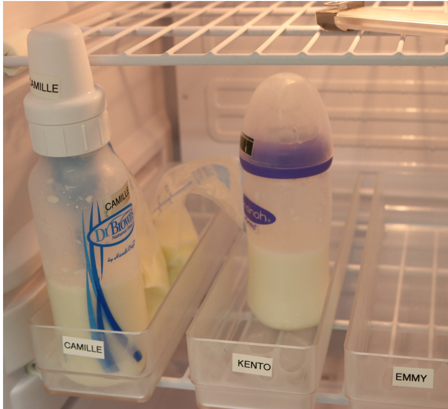
Ilustración 3: Almacenamiento de la Leche Materna en un Hogar que Provee Cuidado para Niños

La Ilustración 3 muestra el almacenamiento de la leche materna en un hogar que provee cuidado para niños. Una sección del refrigerador es designada para almacenar la leche materna. Es permitido almacenar leche materna en un refrigerador domestico junto con otra comida y bebidas. La leche materna está siendo almacenada en botellas y bolsas y organizada en contenedores claramente etiquetados con el nombre de cada bebé. Las botellas y bolsas También son etiquetadas con el nombre cada bebé y con la fecha en la cual la leche fue extraída. El contenedor de la orilla izquierda tiene varias bolsas de leche en la parte trasera, enfatizando que la leche de la botella se debe usar primero.